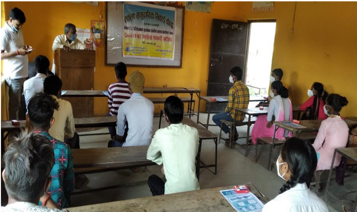
एकला सामुदायिक सिकाइ केन्द्रमा कोभिड-१९ विरुद्ध सचेतना कार्यक्रमको भलक