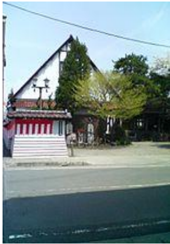
The First Kominkan in Japan, 1946