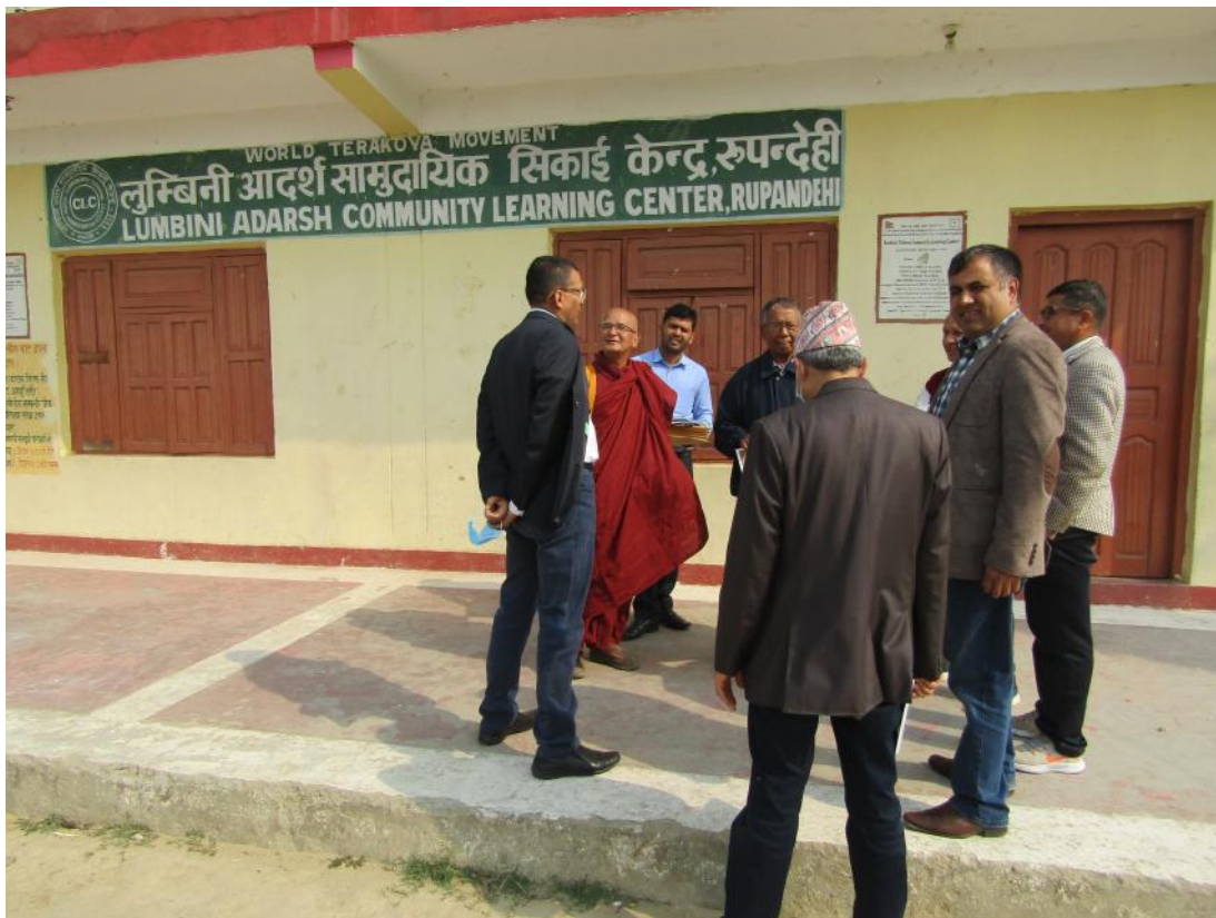
लुम्बिनी आर्दश सामुदायिक सिकाइ केन्द्रमा शिक्षा सचिवको अवलोकन भ्रमण