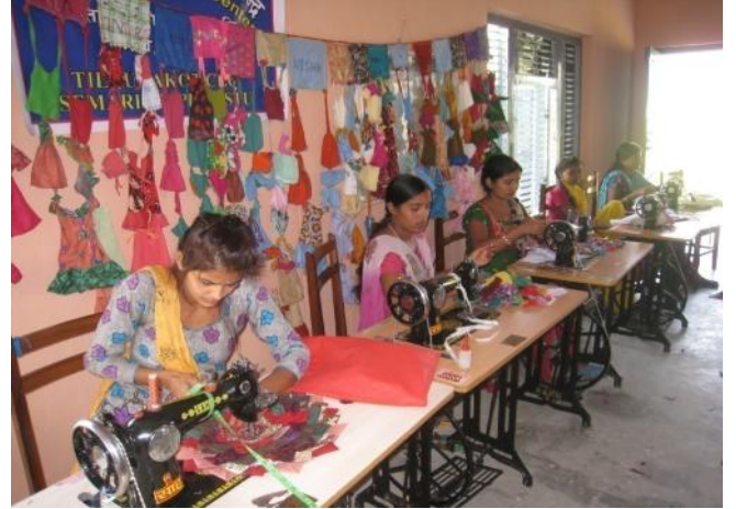
तिलौराकोट सामुदायिक सिकाइ केन्द्र, कपिलवस्तुमा सिलाइ कटाइ कार्यक्रम