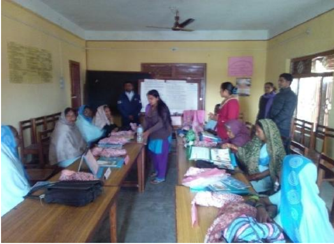
खुदावागर सामुदायिक सिकाइ केन्द्र, रुपन्देहीको तालिम कक्ष