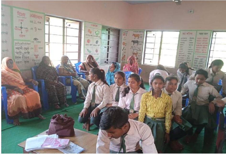
सामुदायिक सिकाइ केन्द्रमा संचालित पारिवारिक साक्षरता कार्यक्रमको भलक